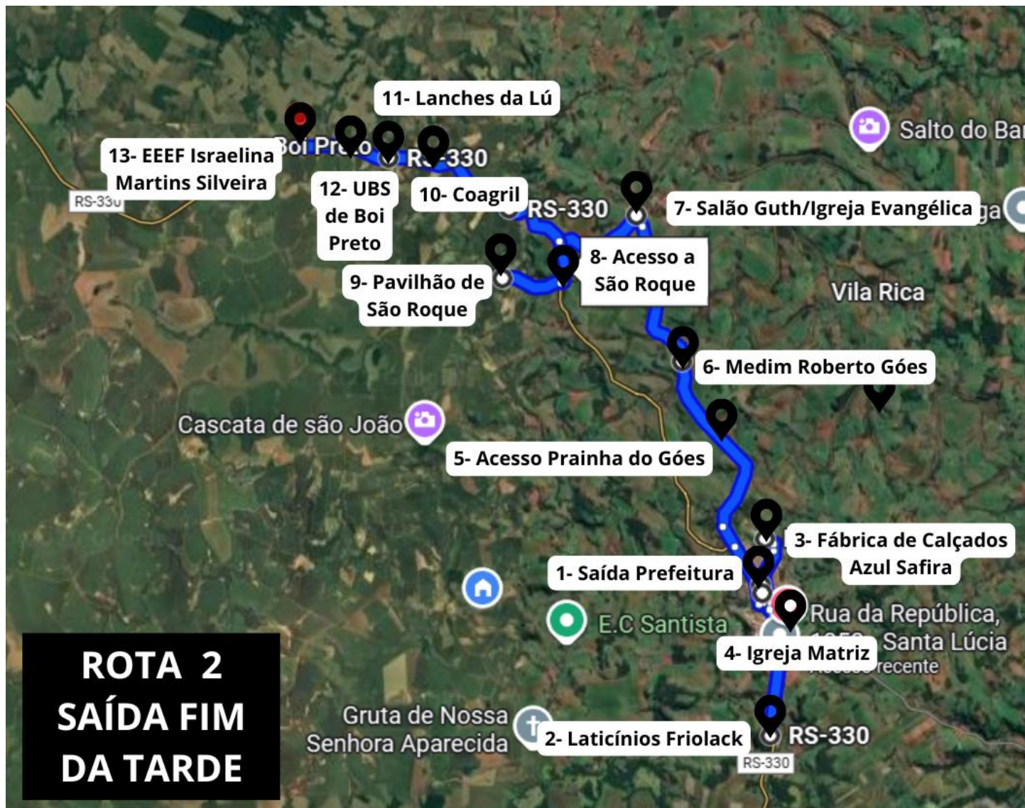
(Visão geral do trecho percorrido, com marcação das paradas)